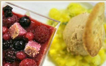
Notre Dessert Gourmand