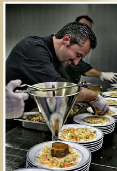
Notre Plat chaud